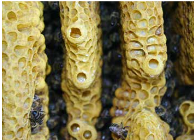
Bei gesteigertem Schwarmtrieb: Gut zu erkennen ist die abgerundete Wabenkante und polierten bzw. belebte Spielnöpfchen.