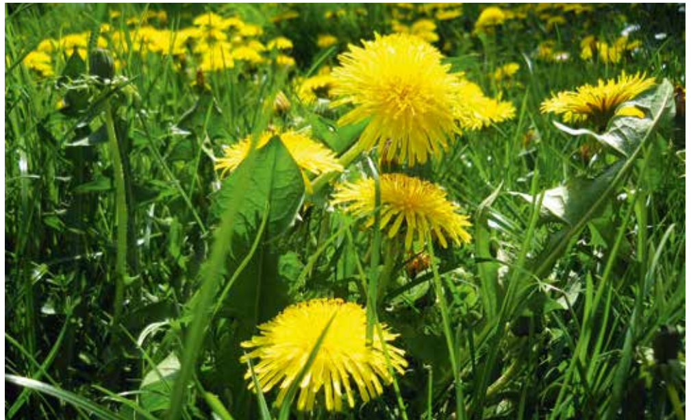
Der Löwenzahn ist selten geworden in unseren Intensivwiesen – Ohne Weidewirtschaft und Heuwiesen kein Löwenzahn.

Bei einer Massentracht (Raps, Obst, Löwenzahn etc.) schaffen die Bienen es, innerhalb einer Woche, den Honigraum zu füllen. Werden die ersten Waben weiß verdeckelt und sind die benachbarten Waben mit Honig angetragen, kann man das Erweitern durch Unterschieben eines zweiten Honigraumes (ausgestattet: s.o.) realisieren. Bleibt das Wetter schön, nehmen die Bienen ihn zügig an und tragen