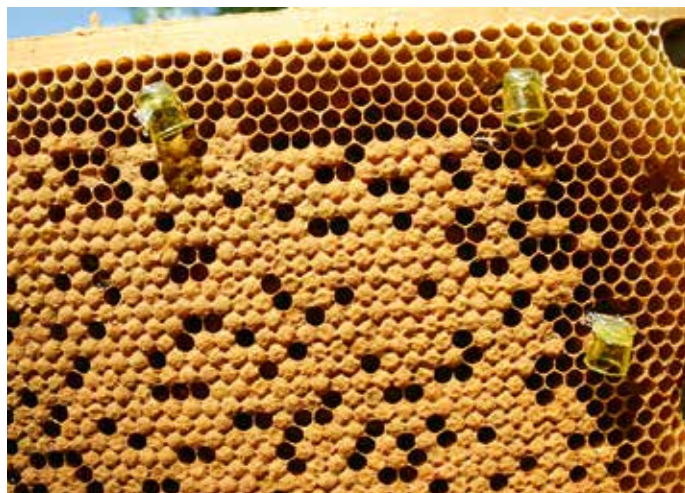
Belarvtes Büroklammer-Näpfchen einfach auf den Brutwaben, durch Einstecken, fixieren.

Eine Stunde nach Bildung, fängt der Sammelbrutableger an zu Brausen,