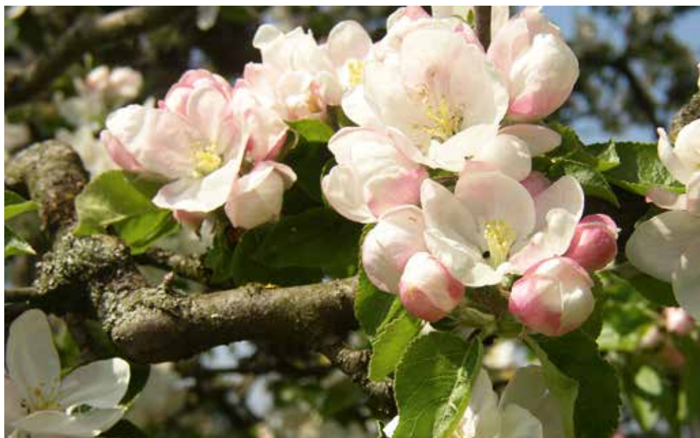
Apfelblüten erinnern an Rosenblüten, kein Wunder der Apfel gehört zu den Rosengewächsen

natürlich ein unbedingtes Muss. Hier noch eine kleine Checkliste zur Wanderung: