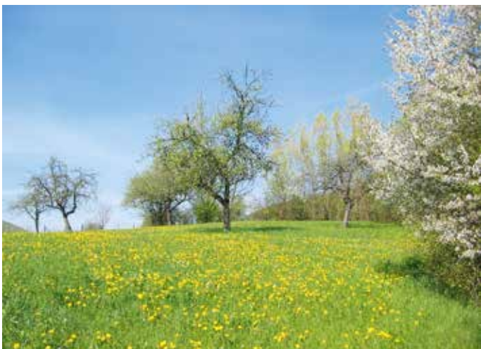
Ein Festessen ist angerichtet für Nektar- und Pollensammler: Unsere ausgeräumte Kulturlandschaft bietet immer häufiger unzureichend Nahrung über das ganze Jahr.

Viele Imker erkennen den Schwarmtrieb der Völker erst an gedeckelten Schwärmzellen und versuchen sich dann über Zellen brechen zu retten. Einige verlassen sich auf die Kippkontrolle mit Durchschau der Wabengassen nach Schwärmzellen. Hier die drei K's des Misserfolgs: „Kippen, Knicken, Klettern“ – Nach zwei bis drei „Schwarmverhinderungseinsätzen“ hängt das 1m lange Ergebnis beim Nachbarn am Baum, peinlich, peinlich – Hohn und Spott der eigenen Familie gibt es gratis dazu. Zirkusreife Einlagen beim Einfangen der Schwärme erfreu-