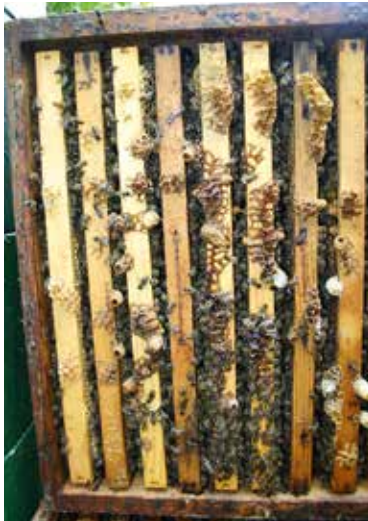
Kippkontrolle mit Schwärmzellen, hier hilft kein Schröpfen mehr – das Volk muss in einen Flugling und einen Brutling geteilt werden, um das Schwärmen sicher zu unterbinden.

Honigraum zügig ausgebaut, voll Honig getragen und teils verdeckelt. Jetzt plagen den Imker folgende Fragen: