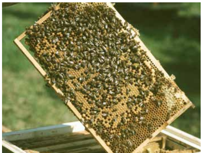
Solche großflächig verdeckelte Schröpfwaben entnimmt man – mit Bienen, ohne Königin – zum Bilden von Sammelbrutablegern.