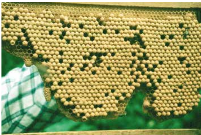
Drohnenträger mit girlandenartigem Ausbau – ein Zeichen für höchsten Schwarmtrieb. Unschwer sind die angesetzten Schwarmzellen zu erkennen.