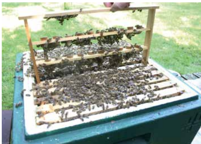
Blick in den Sammelbrutableger: Der Zuchtrahmen ist gut belagert und angenommen worden