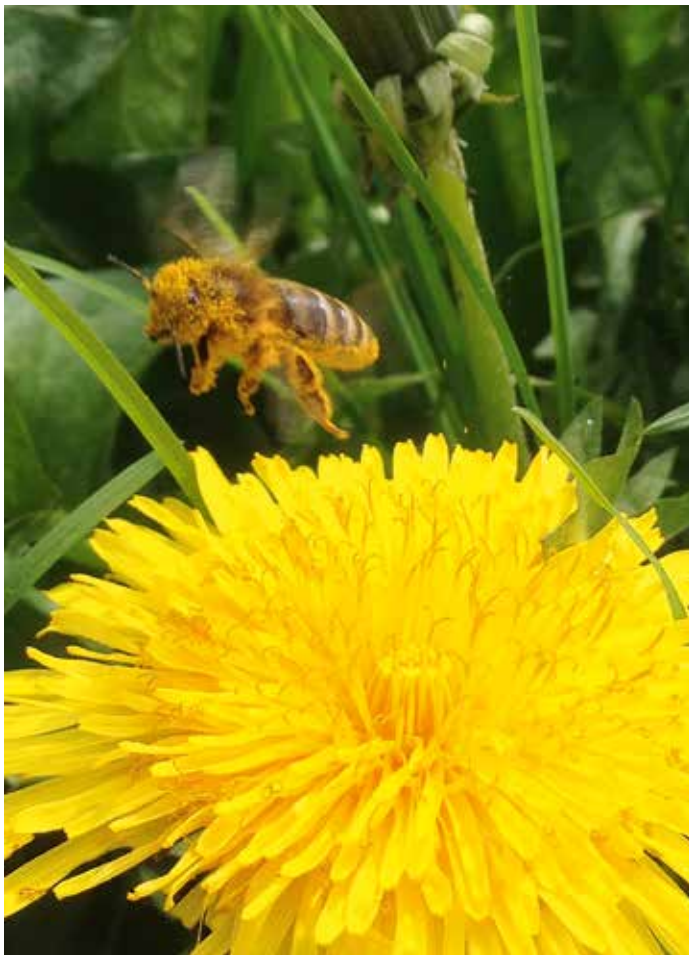
Bienen lieben Löwenzahn.

Für den Berufsimker unerlässlich, für den Hobbyimker eine Option, will man Sortenhonig haben, ist das Wandern mit Bienenvölkern unerlässlich. Doch eine Wanderung mit Bienen will wohl geplant sein: Ein rechtzeitiges Einholen von Gesundheitszeugnis (Seuchenfreiheitsbescheinigung von Bienenvölkern) und Wandergenehmigung sichern das Vorhaben, die Genehmigung des Grundstückbesitzers zum Aufstellen der Völker am Wanderplatz ist