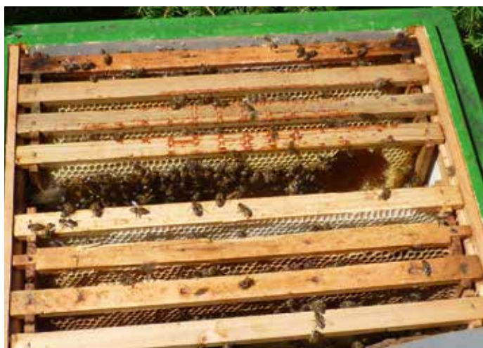
Futtermangel, Futtertasche muss in Kontakt zum Bienensitz und nicht an den Rand!

Wer die Absicht hegt einen Standortwechsel oder einen Platztausch um wenige Meter, mit seinen Bienen vorzunehmen, der hat jetzt eine günstige Gelegenheit dazu: In der Winterruhe vergessen die Flugbienen die „Koordinaten des Standortes“, stellt man in der Winterruhezeit die Beuten innerhalb ihres Flugkreises um, so kommt es nicht zu Rückflügen zum alten Platz. Diese Umstellaktionen müssen erschütterungsfrei und nicht bei